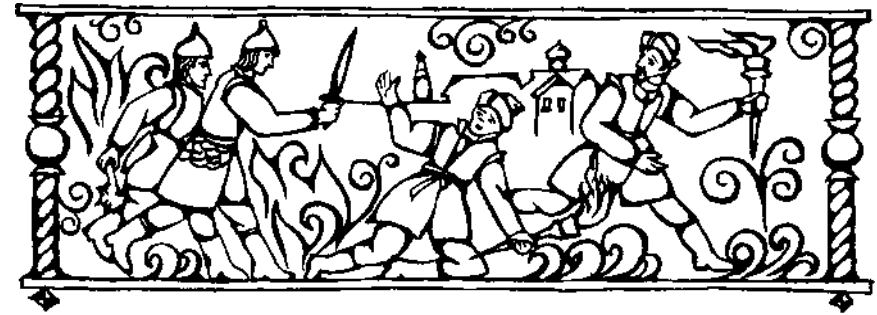
город на три части.

При сильном ветре, случалось, огонь перекидывался из одной части города на другую, несмотря на широкие полноводные реки, делившие